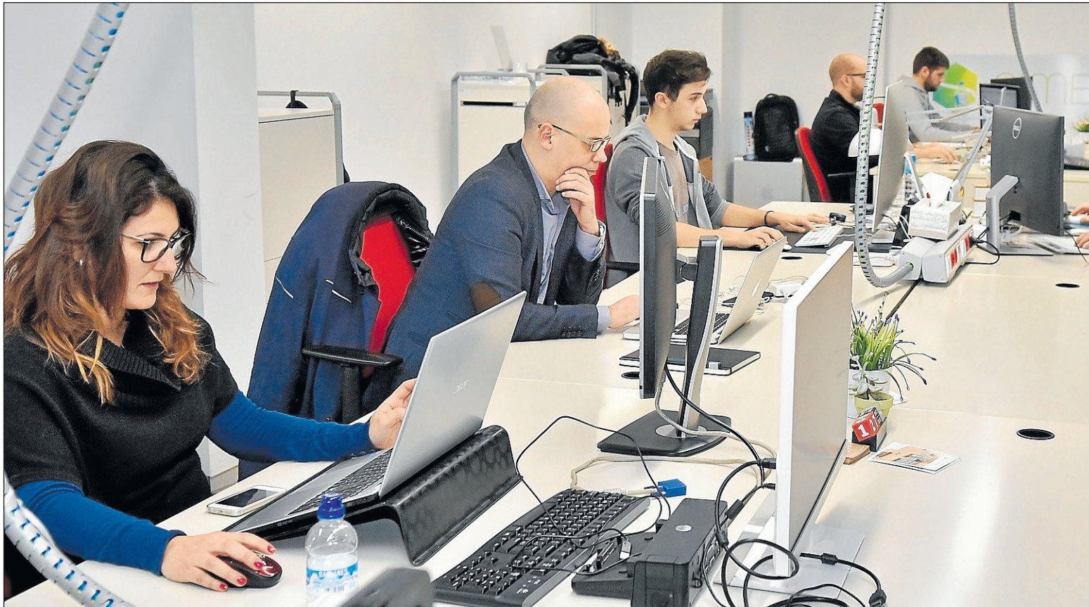
En las instalaciones de Tarragona Impulsa el espacio 'coworking' acoge siete actividades empresariales.

En las instalaciones de Espai Tabacalera conviven siete empresas de sectores tan diversos que van desde las nuevas tecnologías a la energía.